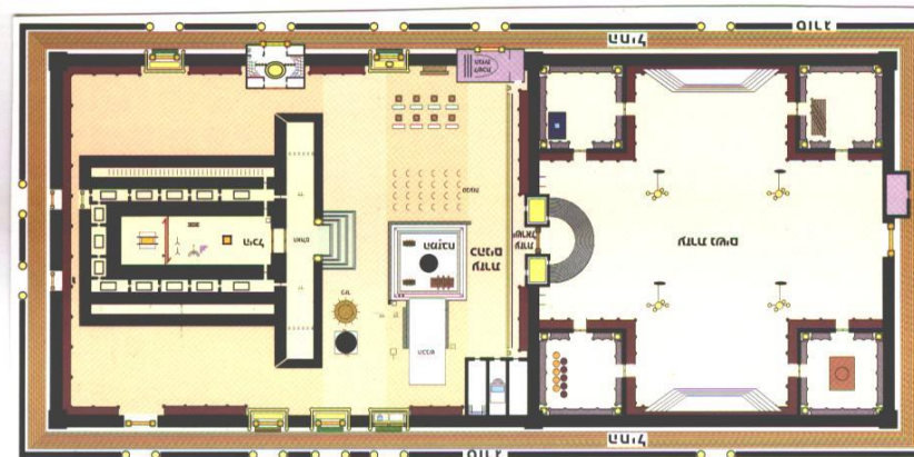
יזא אגז גא סיגולא

(טז) [יז] החיל מקודש ממנו שאין גרים וטמא מת ובוועל נדה נכנסין לשם. (יז) עזרת הנשים מקודשת מן החיל שאין טבול יום נכנס לשם, ואיסור זה מדבריהם אבל מן התורה מותר טבול יום להכנס למחנה לוי, וטמא מת שנכנס לעזרת הנשים אינו חייב חטאת.