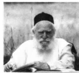
16. Igros Moshe o.c. 4:2 R' Moshe Feinstein 1895-1986