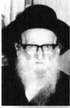
15. Minchas Yitzchak 3:33:3 R' Yitzchak Ya'akov Weiss 1902-1989

ג) בענין גילוי הראש במשרדי הממשלה, — הנה כבר האריכו צוה גדולי הפוסקים, בהמבואר בטוש"ע (או"ח סי' ז' [ס"ו], ח' [ס"א]), ס"א [ט"ז סק"א], ו"א [ס"ג]), ע"י צרכי יוסף שם, ורבים הם הסוברים לאסור מן הדין, דמש"כ נש"ס צוה, לאו משנת חסידים הוא אלא דינא הכי, או משום דצוה"ז שהוקבע ונתפשט מאד בין העמים איכא צוה משום בחקותיהם, ומ"מ אי אפשר לומר כלל צוה, צנוגע למשרדי הממשלה, והכל לפי המקום והזמן, אם הממשלה אינם מקפידים ע"ז, וע"י נשבו"י (ח"ג סי' ה') ונשד"ח (מע' ביהכ"נ אכס"ד ח').