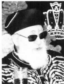
10. Yechaveh Da'as 4:1 R' Ovadia Yosef 1920-2013

שהיה אוכל ושותה בהכשר רק שהיה בגילוי הראש היו תופסין אותו כאלו יצא מן הכלל. ע"כ החכם עיניו בראשו שידע להשמר שלא יתפשו עליו ואם כבוד עליו להגיה על ראשו דבר כבוד יכסה ראשו בבגד פשתן דק או במשי ומ"מ נראה אפי' מי שירצה לברך ברכת נהנין והוא בלילה שאין לו כובע עליו או כשרוחץ באמבטי די לו במה שמכסה את ראשו בידיו אף שגדול אחד העתיק לאיסור ומהרר"א הביאו וראיתו מר"ת שכשהיה רוחץ בהמין והיה שותה היה מתכסה בבגד כנגד לבו כו' משמע דוקא בבגד ולא בידים אין זה ראייה כי מ"ה לא חשוב כיסוי שדרך האדם להניח ידיו על לבו והרואה לא ידע שצריך לכסות את הלב או ידמה לו שלא כסו ממש כנגד הלב אבל למעלה מראשו שהוא דבר הניכר מספיק בכיסוי היד בפרט לפי מה שכתבתי שאין בו איסור כ"א חסידות מספיק לו כיסוי היד בפרט באקראי בעלמא.