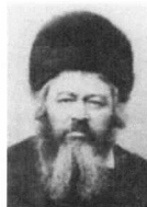
24. Aruch Ha'Shulchan o.c. 2:10 R' Yechiel Michel Epstein 1829-1908

י איתא בקדושין שם רב הונא בריה דרב יהושע לא מסני ד' אמות בגילוי הראש אמר שבינה למעלה מראשי ואיהו גופא אמר בשבת [ק"ח:] תיתי לי דלא סגינא ד"א בגילוי הראש ושם [ק"ו:] איתא כסי רישך כי היכי דתיהוי עלך אימתא דשמיא ומביא שם מעשה שגילוי הראש הביא אדם לידי עבירה ואיתא במס' בלה פעם אחת היו יושבים זקנים בשער ועברו לפניהם שני תנוקות אחד כיסה את ראשו ואחד גילה את ראשו וחקרו אחרי זה שגילה ראשו ונמצא שהוא ממור ובן הנדה ע"ש והענין שהראש שבו המוח שהוא מקור החכמה והיראה אין לו להתגלות לפניו יתב' שמלא כל הארץ כבודו כמו שאין לעמוד במקום קדוש בגילוי ראש ואם אינו עושה כן עוות יצרו מתגבר עליו גם בלא הרגשה והנה יש מן הגדולים הסוברים שמעיקר הדין יש איסור בזה ויש שסוברים שוהו רק ממדת חסידות אמנם אם כה ואם כה הנסיון יעיד על זה [ובמקום ההכרח כמו בערכאות הקיר"ה שמדינתא דמלכותא אין לילך בכיסוי הראש בשם מותר אך שלא במקום הכרח מני שרואה לזכות צידאת ה' ישמור ח"ע מזה ודי למצין ודוק]: