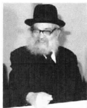
23. Emes L'Yaakov on Shulchan Aruch R' Yaakov Kamínetzky 1891-1986

מ"ב סקי"ב: ופרוק משערות אף אותן שתפורין בבגד מתחתיו יש לאסור מפני מראית העין שיאמרו ששערות הן ויש מקילין. ועיין בהערה. 3