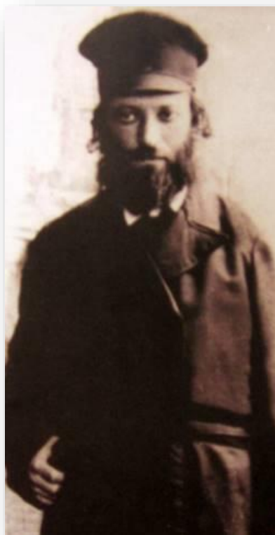
Rav Avraham Yitzchak Hakohen Kook, 1888 Zoimel, Lithuania