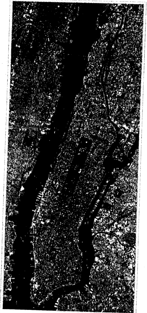
Central Park is visible in the center of this satellite image. Manhattan is bounded by the Hudson River to the west and East River to the east.

Manhattan is connected by a bridge and tunnels to New Jersey to the west, and to three New York City boroughs—the Bronx to the northeast and Brooklyn and Queens on Long Island to the east and south. Its only direct connection with the fifth New York City borough is the Staten Island Ferry across New York Harbor, which is free of charge. The ferry terminal is located at Battery Park at its southern tip. It is possible to travel to Staten Island via Brooklyn, using one of Brooklyn's bridges, the Verrazano-Narrows Bridge.