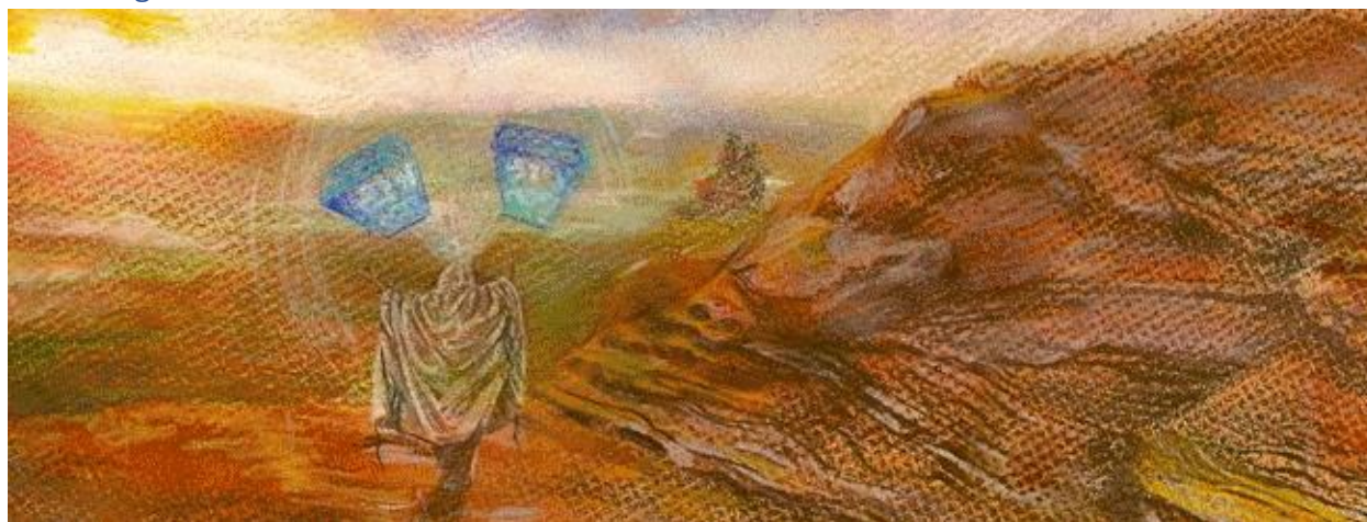
21. Mishech Chochma, Shmos 32:19

ואל תדמו כי המקדש והמשכן המה ענינים קדושים מעצמם, חלילה! השם יתברך שורה בתוך בניו, ואם "המה כאדם עברו ברית" (הושע ו, ז), הוסר מהם כל קדושה, והמה ככלי חול 'באו פריצים ויחללוהו'. וטיטוס נכנס לקודש הקדשים וזונה עמו ולא ניזוק (גיטין נו, ב), כי הוסר קדושתו. ויותר מזה, הלוחות - "מכתב אלקים" - גם המה אינם קדושים בעצם רק בשבילכם, וכאשר זנתה כלה בתוך חופתה המה נחשבים לנבלי חרש ואין בהם קדושה מצד עצמם, רק בשבילכם שאתם שומרים אותם. סוף דבר: אין שום ענין קדוש בעולם מיוחס לו העבודה והכניעה, ורק השי"ת שמו הוא קדוש במציאותו המחוייבת, ולו נאווה תהילה ועבודה. וכל הקדושות המה מצד ציווי שצוה הבורא לבנות משכן לעשות בו זבחים וקרבתות לשם יתברך בלבד.