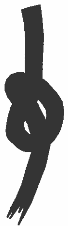
קשר אחד כראש החוט