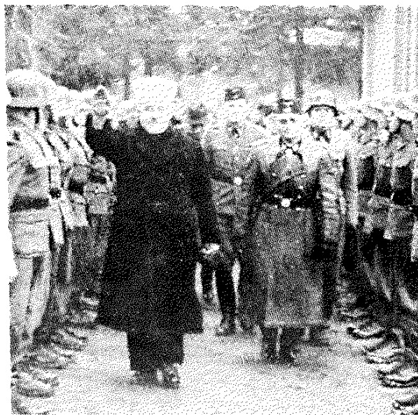
The Grand Mufti of Jerusalem reviewing Nazi troops.

With World War II, this long epoch was brought to a crude and malevolent close. In 1923 Hitler wrote Mein Kampf spelling out his belief that the Jewish people should "ל" be wiped out. This was read by Haj Amin el-Husseini, the Grand Mufti of Jerusalem, who found