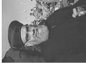
15. Asefi Lechia Rav R' Chaim David Ha'Levi 1924-1998

וראיה לדבר מדין מורא אביו שהוא איסור תורה, ושנינו בברייתא