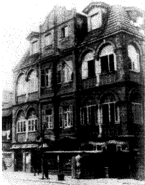
The Mir Yeshiva building in the Shanghai ghetto, China, 1945