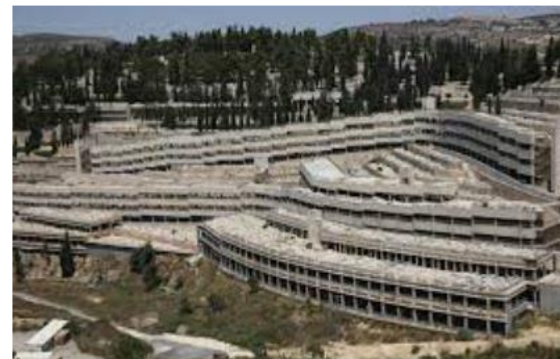
גמרא בבא בתרא (ק, ב)