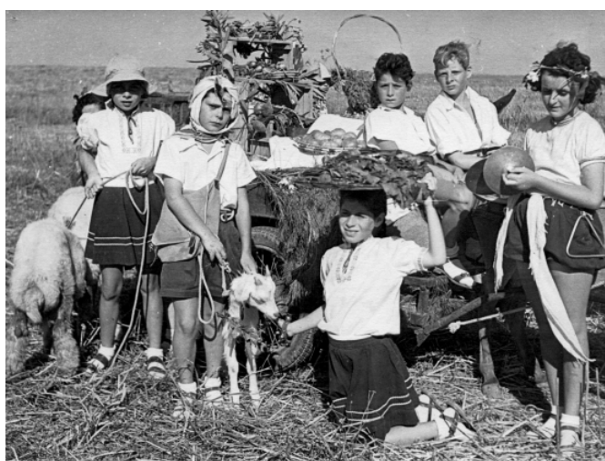
ביכורים בקיבוץ עין השופט - שנת ה-50