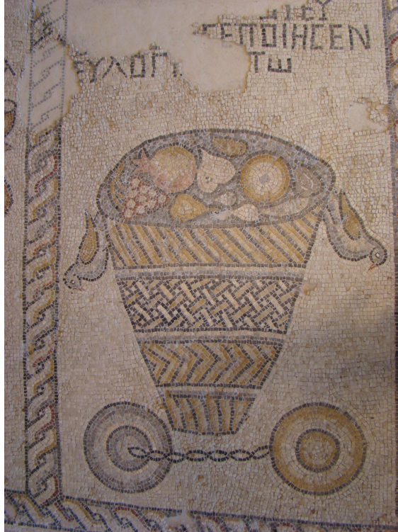
בית כנסת העתיק, ציפורי