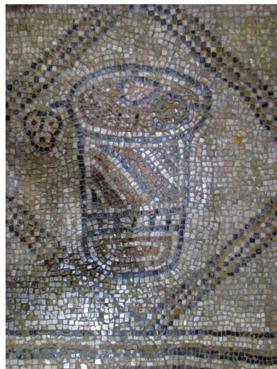
בית בנסת העתיק, בית אלפא