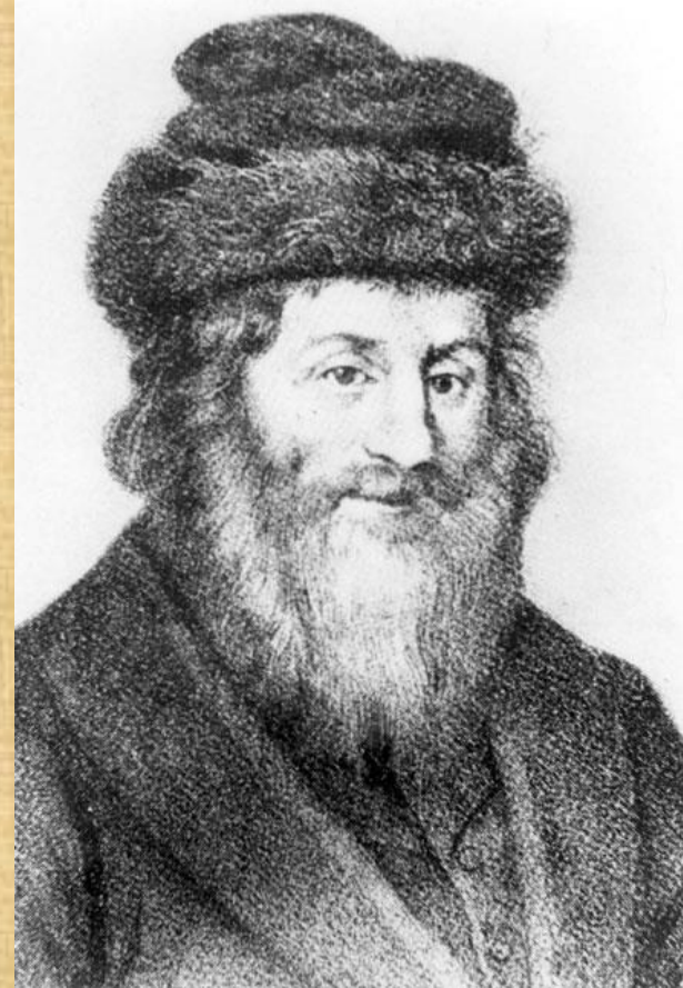
הרב משה סופר (שרייבר), 1762-1839, נודע בשם "חתם סופר".