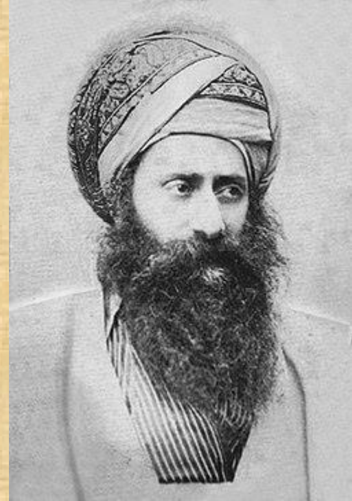
ה"בן איש חי" - הרב יוסף חיים מבגדאד, 1835-1909

הבן איש חי [הרב יוסף חיים מבגדד, 1835-1909, בן יהודיע, בב"ק ס' עמוד ב']- יען כי זה החולי של החולירע יזיק לאדם הפחד וההבעתה, ויתהווה בו החולי מחמת הפחד... ולכן טוב לברוח למקום רחוק.