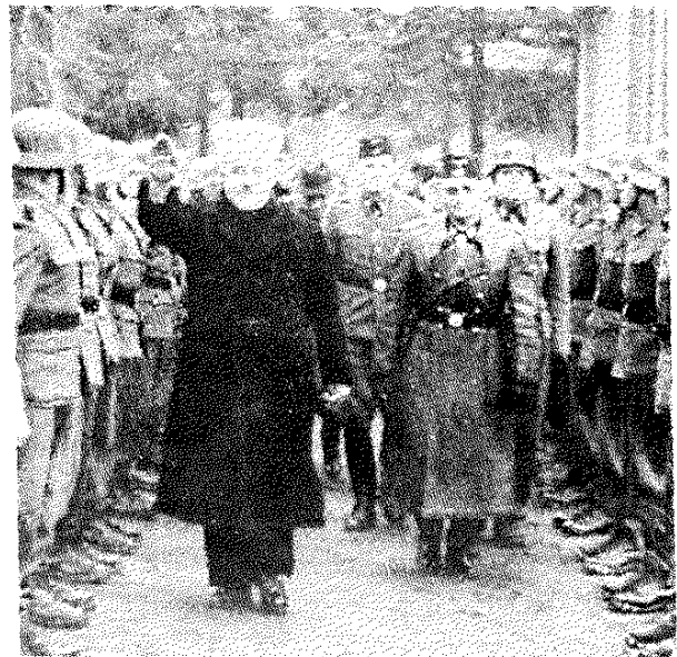
The Grand Mufti of Jerusalem reviewing Nazi troops.

With World War II, this long epoch was brought to a crude and malevolent close. In 1923 Hitler wrote Mein Kampf spelling out his belief that the Jewish people should "ל" be wiped out. This was read by Haj Amin el-Husseini, the Grand Mufti of Jerusalem, who found