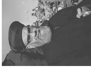
15. Asefi Lechia Rav R' Chaim David Ha'Levi 1924-1998

וראיה לדבר מדין מורא אביו שהוא איסור תורה, ושנינו בברייתא