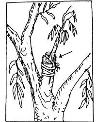
Peirush Chai, pg 167