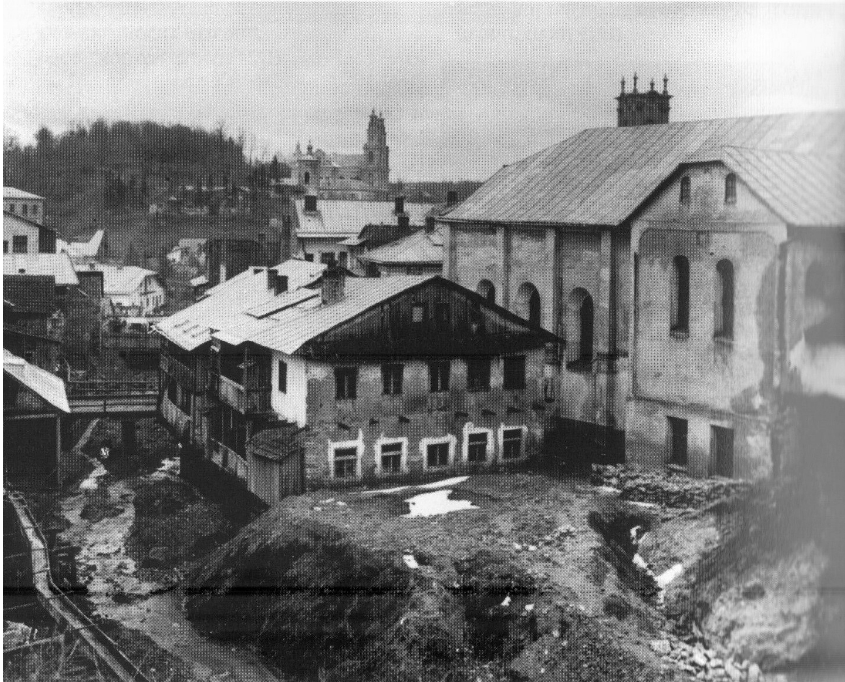
בוציאץ', פולין, מראה העיר ובית הכנסת הגדול (1922)