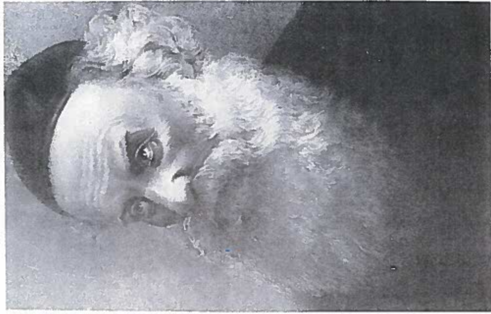
R' Shneur Zalman, the Ba'al HaTanya

The Gaon once told his disciples that the righteous ones in the World to Come eagerly await the arrival of a talmid chacham who is being elevated to the Heavenly yeshiva so that they can hear his chiddushai