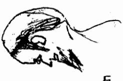
תשכ"ב - תשכ"א

אמר לי מור"י שהי' מספר את מרן החזו"א זצוק"ל והראה לו מרן שיעור הפיאה מהמקום שמעגל העלינה שמעל האוזן מחזיל להשתפע לצד הפנים ומשם עולה בשפע עד הפנה העלינה במצח שמחזקרים שם שערות הצדע עם שערות הראש, כל השערות שבתוך שטח זה פאה ושאר השערות מלתרים, כאן שני ציורים שצייר מור"י ר. ת. שעסקנו בנר"י, ובהם הראה לי במדויק את שיעורם, הציורים משני זמנים שבהם עסקנו בהלכה זו, הציור מתשכ"ז הוא המאוחר יותר.