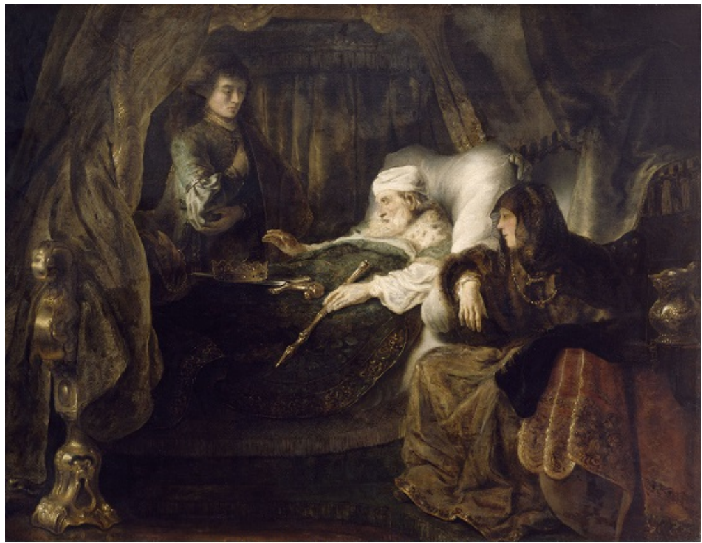
"David's Dying Charge to Solomon" By Ferdinand Bol (1616-1680)

יב כי ימלאו ימיה, ושכבת את-אבותיך, והקימתי את-זרעך אחרריך, אשר יצא ממעיך; והכינתי, את-ממלכתו.