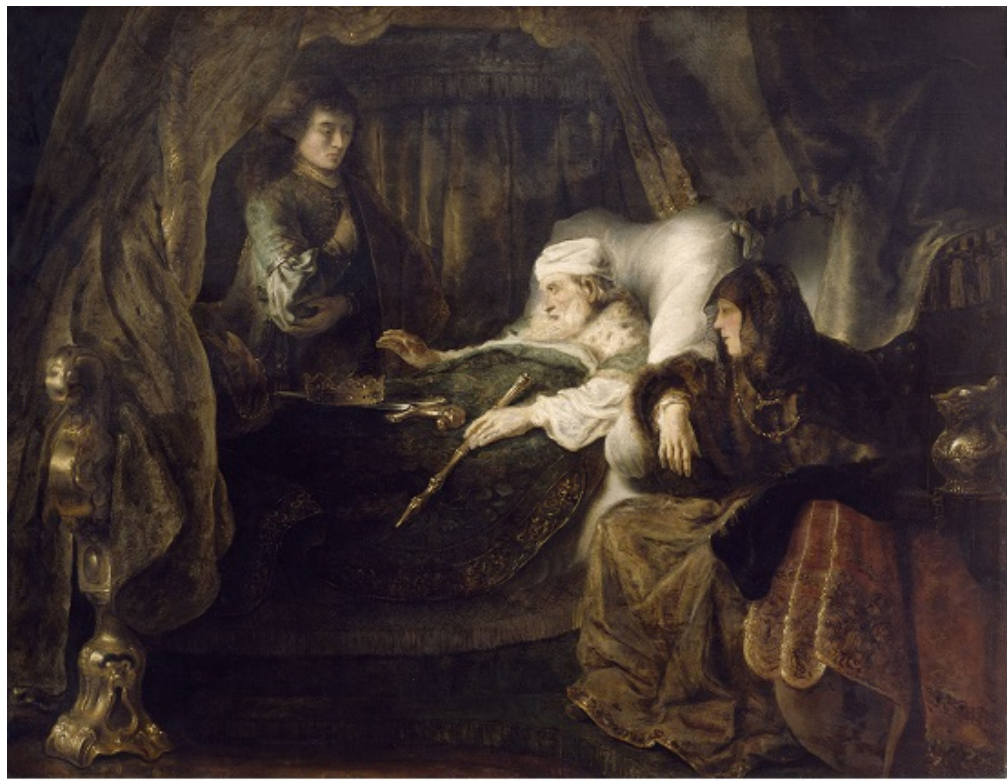
"David's Dying Charge to Solomon" By Ferdinand Bol (1616-1680)

יב כי ימלאו ימיה, ושכבת את-אבותיך, והקימתי את-זרעך אחרריך, אשר יצא ממעריך; והכינתי, את-ממלכתו.