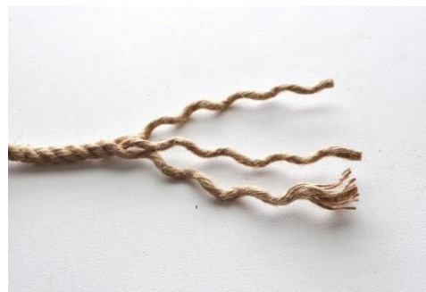
חפץ בדוד וגלה הדבר לדוד:

וידבר אחר שרצה להרגו בשוגג בחניתו, ועל ידי חרב פלשתים, ולא עלתה בידו, רצה להרגו בדעת על ידי שלוחיו, אבל יונתן