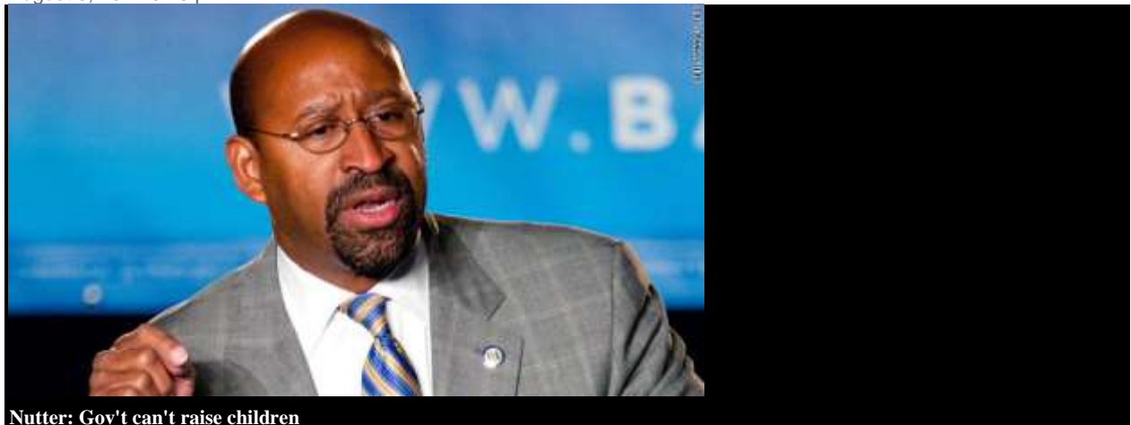
Nutter: Gov't can't raise children

(CNN) -- Philadelphia's mayor described his stiff curfew on teenagers' "flash mob" attacks on city residents as a dose of "tough love" and called for parents to keep better watch on their kids.