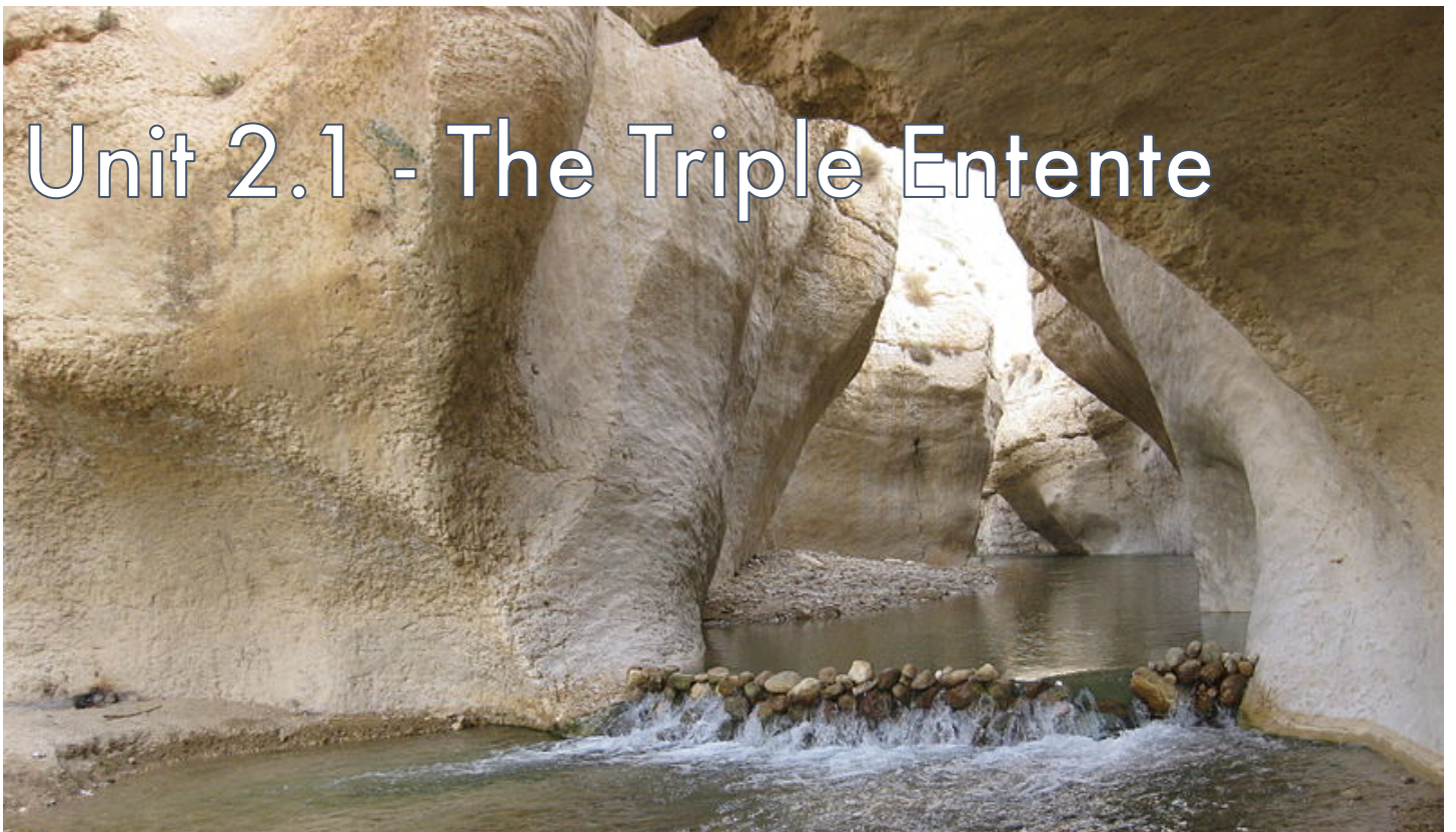
Yehoram of the North (3:1-3)