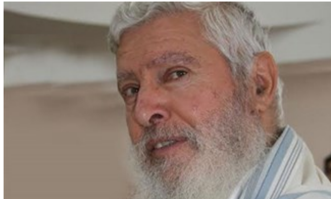
The ultimate loyalist till almost the end.

נראה כי המלכות, במיוחד בשעת יצירתה, זקוקה לכוח שכזה. היא בנויה על נאמנות וצייתנות, על שעבוד כל הכוחות לאומה ולמלכה: כל-איש אשר-ימדה את-פיך ולא-ישמע את-דבריך לכל אשר-תצוונו יומת - רק חזק ואמץ! 17 את התפקיד שמילא יואב אצל דוד בהקמת מלכותו לדורות, מילא אבנר אצל שאול. אין זו השתעבדות לאיש אלא לרעיון, לאידיאל הממלא את כל רוחו של האדם.