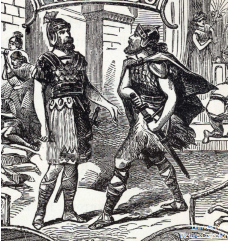
Rechav and Baanah