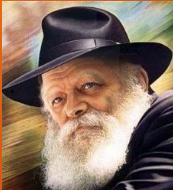
R. Menachem M. Schneerson , Brooklyn, 1902-1994

פ. לפי זה ניתן לומר, שפירושו של המאמר "כשהמאורות לוקין סימן רע הוא לעולם", איננו רק שזהו זמן מועד לפורענות, להענשה על התנהגות בלתי רצויה, אלא שזהו זמן שבו מתעוררות בטבעו של האדם נטיות להתנהגות לא טובה, אך עדיין אין הכרח שהאדם אכן יושפע וינהג שלא כראוי, שהרי בכוחו להתגבר על נטיות אלו.