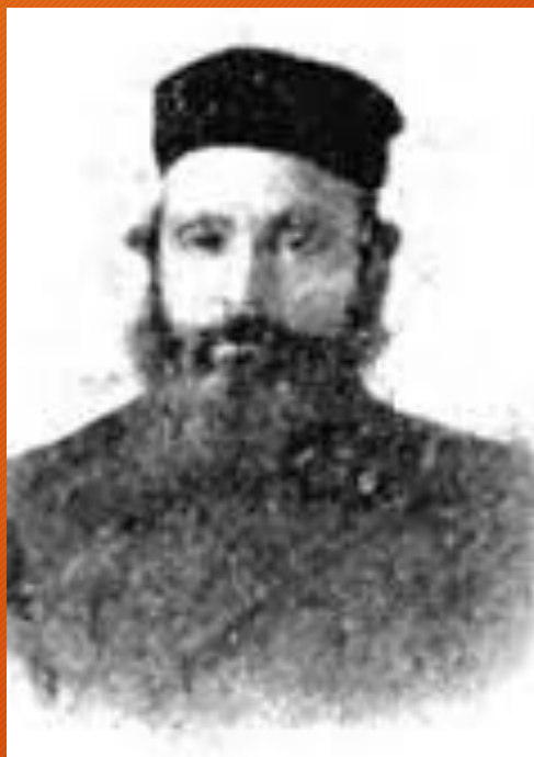
R. Simcha Zissel Ziv (1828-1898)

שמעו בית ישראל את אשר אגידה כי הלא דבר הוא.