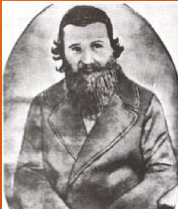
R. Moshe Shik, born in Slovakia, died in Chust, Ukraine, 1807–1879