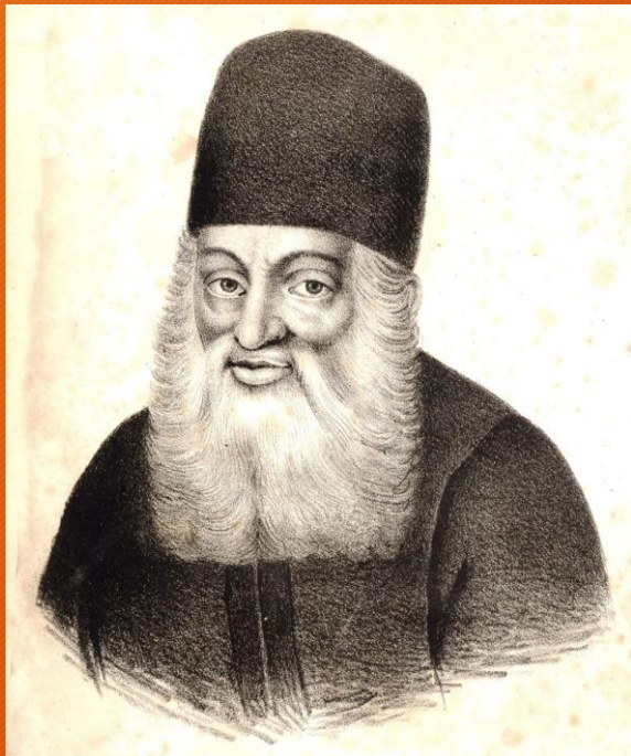
R. Yehonasan Eibeshitz, Eibeshitz, Prague, 1696-1764

וכבר הבינו רבים זה הכוונה בליקוי הוא הגיגוד מקורו ליקוי חמה ליקוי לבנה ולכך לחקו צעירים על דברי ח"ל מדבר זה סבשי הוא ע"ס תשבון ויכול אדם לחשוב מהיום עד סוף. עולם כמה פנים יהיו בו הליקוי המאורט באזיה יום ובאזיו שעה ובאזיה מקום ועל המדינות יאמר אזיה ירגישו ואזיה לא ירגישו וא"כ מה זה דהיי"ש לחסל וענש. אך באמת אין זה עס ליקוי ואס יקמית אדם דבר בפני נר המוצץ ביט לאורו וכי הליקוי בנר הלל נר מבהיק אורו מבלי חסרון רק חסרון במקבליס שיש כאן דבר חוצץ ואף כאן בזמן נגודים ר"ל כי השמש והירח הילכין ומאירין מבלי השתטח רק הלבנה נוצץ בפני חמה או לל ארץ חוצץ בפני לבנה ומה זה ליקוי אשר יקרה לו : אך באמת הוא כך כאשר דרשתי כבר כי לפעמים נמצא בחמה ענמה כחמים גדולים כאשר מלאו בזמנים צבלי הצפה וכחמים אלו אין להם סבה ידועה ומל"ש זמן ידוע ותשבון וכאשר יהיה בו כחמים אין אורו מבהיק כל כך כמו צלי כחמים ואס כן זהו ליקוי חמה באמת כי החמה חסס אורה חהו סיבת עונש וזהו מאירות לוקין ובאמת לעבירות שטלד בו אין חט מרגישים בו כלום בהעד קצת אור מהחמה אבל קדמונים הרגישו למאוד בחסרון אורה כרב או במעט