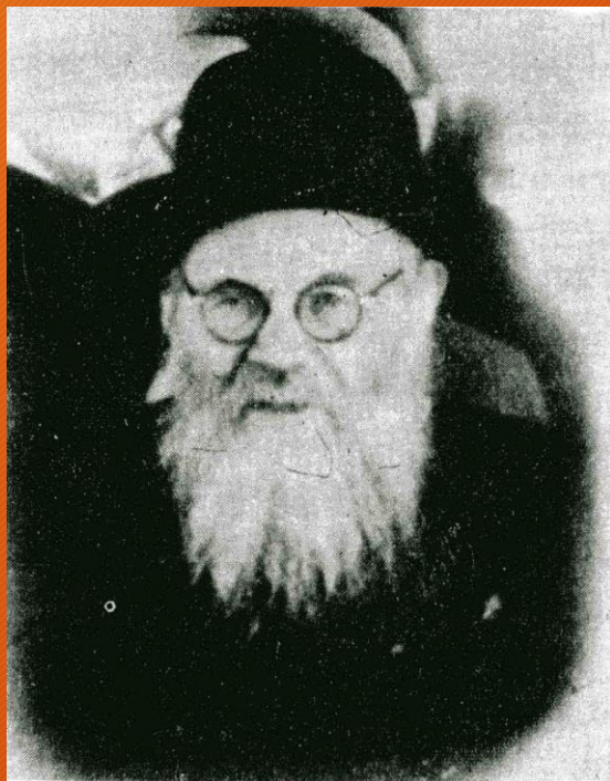
R. Elijah Lopian (1876-1970)