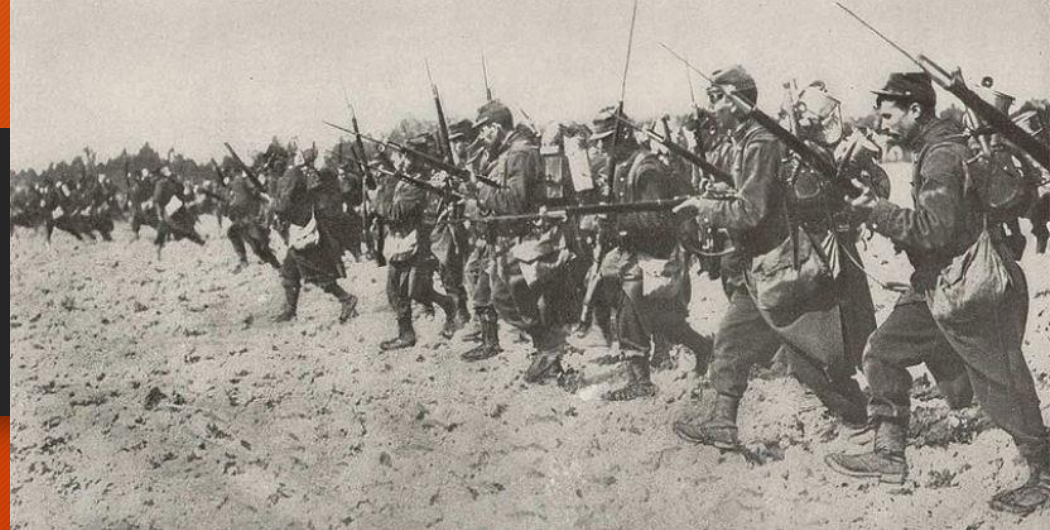
Battle of the Frontiers, August 22 nd 1914

הראיתי להרב שליט"א עדותו של הרב אריה פינסקי, שפורסמה ברבים, שבהיותו נער קטן, בשנת תשט"ו לערך, זכה ללמוד חומש רש"י עם זקיננו הגה"צ ר' אליהו לאפיאן זצ"ל בהיכל ישיבת קמניץ בירושלים. אמו ביקשה ממנו שילמד עמו פרשת השבוע - פ' בראשית, וכשהגיע לפסוק "והיו לאותות ולמועדים ולימים ושנים" (א', י"ד), למד עמו את הרש"י על "והיו לאותות" - שבזמן שהמאורות לוקים סימן רע הוא לעולם... וכאן הפסיק וסיפר לו שיום לפני פרוץ מלחמת העולם הראשונה, היה חושך בחוץ באמצע היום ממש כמו לילה, ולמחרת פרצה המלחמה העולמית הראשונה ששינתה סדרי עולם! (וצריך לברר אם היה שם עפ"י חשבון).