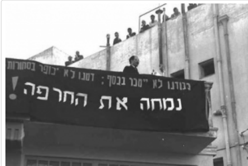
Menachem Begin protesting against the Reparations from Germany Agreement in March 1952. The sign reads: "Our honor shall not be sold for money. Our blood shall not be atoned by goods. We shall wipe out the disgrace!"

To accept or not to accept? That was the question.