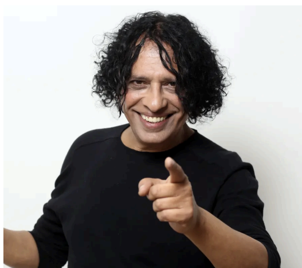
Izhar Cohen (1951)