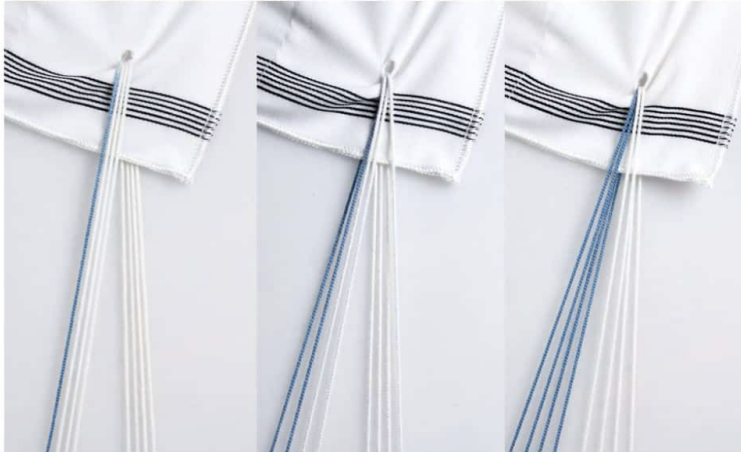
Tosafot 4 of 8