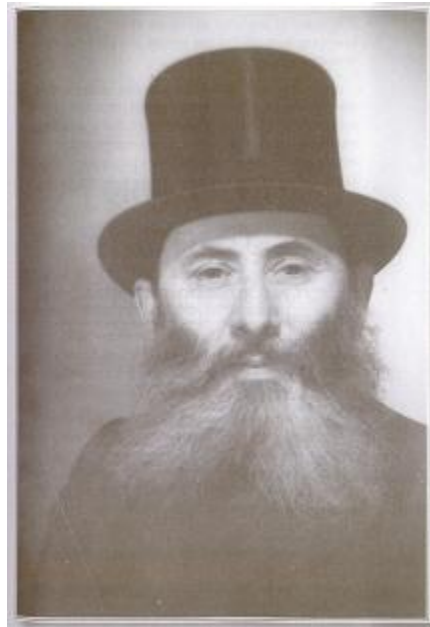
Rabbi Menachem Mendel Kasher (1895 - 1983)

יו"ד אמור הייתה, אם אלו דינים נאמרים, לעוצדי גלולים, עוצרי רגונו יתצרך, לעושי רגונו, התה האומות שממרי' שבע מנות, ונשם חסידים נקראים, על אחת כמה וכמהי וכל ההולך ישר ישפוע משרים, כל הנאלות, ושתנות, ושמות הזויות, וכל האלות, הכתובים בספר התלמוד, וכל חצווי ישראל, התה על האומות הקדמונים, שעשו כל התועבות, אשר טגא ה', כמו הנזאיים, (כמציאר זהרמנ"ס פ"א מהלכות ע"א, וצפירש המשנה במסכת ע"א דף נ"ד ע"ג, וצמורה חלק ג' פרק כ"ט) וכיוצא בהן, עוצדי תרפים וסקוים, אשר החריצו מקדש ה', והרגו חסידיו עליין, ועליהם אמר דוד, (בספר תהלים ע"ט ו') ספוך חמתך על הגוים, אשר לא ידעוך, ועל ממלכות אשר צמך לא קראו, כי לכל את יעקב, ואת נוהו השמו, (וכן נאמר ציר ייה יו"ד כ"ה בקנת שניים) ואף כי עתה תהלה לאל, נאצדו כל עוצדי אלילים, ואין זכרון מכל הראשונים, אשר עבדו לצעל ועקרין, וכיוצא בהן, עם כל זה מנוה לפרסם קלונם צרבים, אולי כמלאים עוד צאיים רחוקים, עוצדי כוכבי שמים, ושלא יקומו עוד רשעים בעולם, ויתהללו צאלילים, וילכו אחרי ההצל הגוים ההם ויהבלו, כמו מאמיני שצתי צני מידח שתנשמים האלהות, ומאמינים גם בחלומות, גם צתרפים, ומחיקים כל ע"ז שהי' בעולם, ומלמדים זכות על עגלי ירצים, והארכתי צתקים אחר י