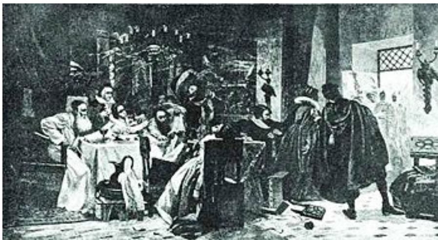
The Inquisition Interrupts A Secret Seder an 1892 painting by Moshe Maimon

אם אין מסור עומד ליד הדלת ומקשיב לפסוקי הפורענות על הגוים.