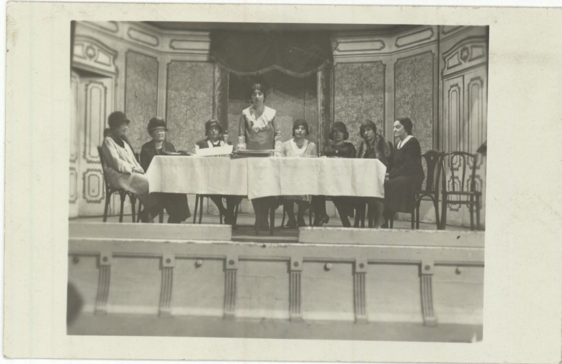
Dais at the Neshei Agudath Israel at its 1929 Founding