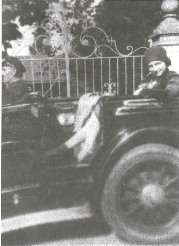
On a fund-raising mission for Bais Yaakov