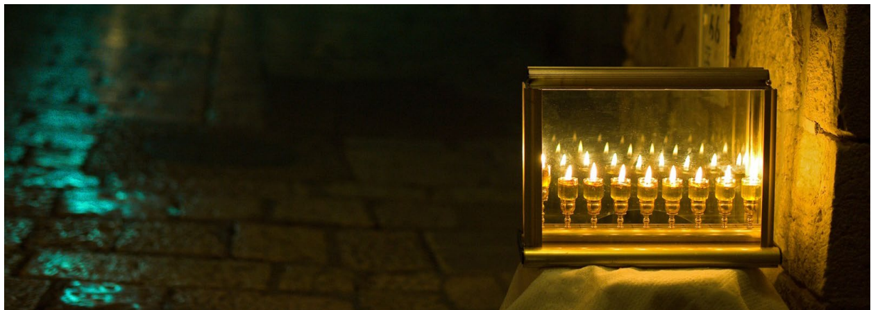
11. Sfas Emes תרמד

אחי מו"ז ז"ל הראה רמז במשנה מחג ועד החנוכה מביא ואינו קורא ולא אומר עד כ"ה בכסליו. לרמז כי נמשך הארת החג עד חנוכה. ולפי"ז נראה כי התחדשות השנה שבתשרי נמשך עד עתה ולכן מביא עוד ביטורים שטוד הזמן בכלל ראשית השנה. ולכן נקרא חנוכה שעתה נגמר החינוך והתחדשות של השנה. ואיתא בשמחת בית השואבה לא היתה חלר שאינה מאירה בלוח בית השואבה ע"ש אריכות הגמ' במטרות שהיו שם. ויתכן לרמז שכונו שנמשך האור מרחוק בעולם. כך נמשך בזמן השנה הארות החג. וכמו כן בגפש האדם כי עולם שנה גפש הם דוגמא אחד. וכפי רוב שמחת נפשות הנדיקים בסוכות כך נמשך האור מרחוק גם בבחי' עולם ושנה. ולכן הדור של תשמונאי התחזקו בימים האלו עוד מהארת החג דכתיב אהרו חג בעבותתם הוא עבותות אהבה ותשוקה כמ"ש במ"א. עד קרנות המזבח רמז לחנוכה ופורים שהם עגפים שזולאין מגוף הרגל ונקראין קרנות המזבח: